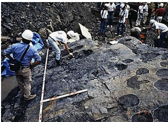
▲恐竜の足跡 平成4年8月3日